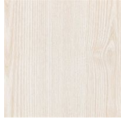
C01 FRASSINO NATURALE