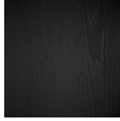
C05 FRASSINO CARBONE