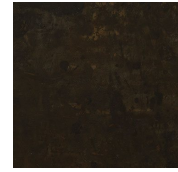
Metallo brunito a mano Hand burnished metal