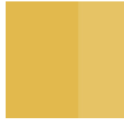
Metallo ottonato Brassed metal