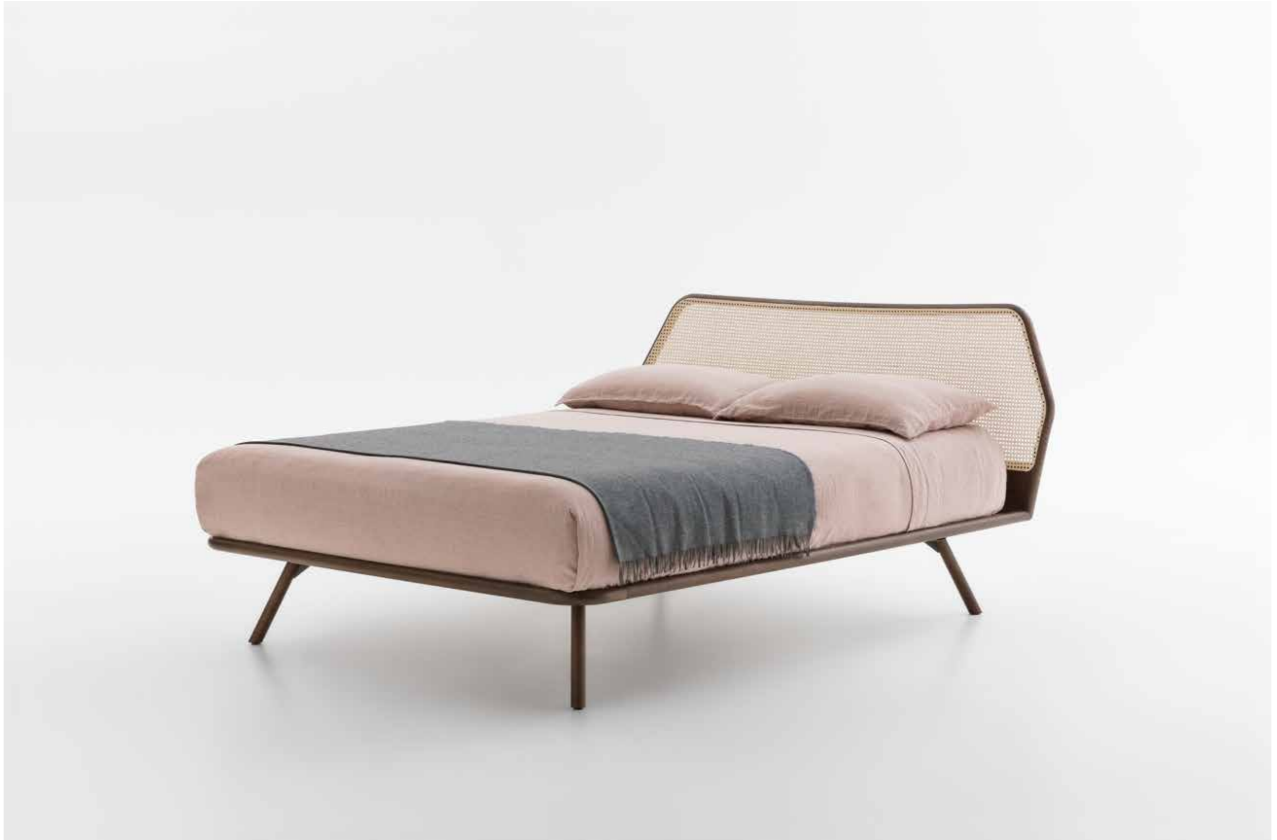
Trama letto Borgogna con testiera Paglia di Vienna. Coordinato tessile Mirum in lino Cipria, plaid Armonica Cumino. / Trama Borgogna bed with Woven Cane headboard. Mirum Cipria linen bedset, Armonica Cumino blanket.