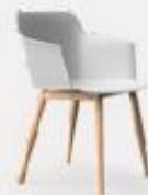
4 WOODEN LEGS L58/43 P54/43 H80/47