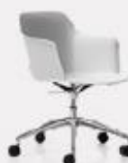
5 RACES TREND L70/43 P70/43 H97/80