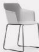
CANTILEVER L58/43 P54/43 H80/47