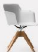
4 WOODEN RACES L70/43 P70/43 H 97/80