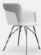
TRALICCIO L58/43 P53/43 H78/45