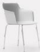
4 METAL LEGS L58/43 P54/43 H80/47