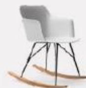
DONDOLO L58/43 P53/43 H75/42