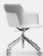
4 RACES LEGGERA L70/43 P70/43 H 97/80