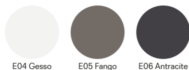
E04 Gesso E05 Fango E06 Antracite

Polaris è in testa ai prodotti di ultima generazione. Frutto della ricerca stilistica e tecnica è un materiale innovativo-nanotech, super opaco e soft touch. La parte esteriore del polaris è ottenuta con l'ausilio di nanotecnologie ed è caratterizzata da una superficie trattata con resine acriliche di nuova generazione, indurite e fissate attraverso il processo di Electron Beam Curing. Con una bassa riflessione della luce, la sua superficie è estremamente opaca, anti impronte digitali e piacevolmente soft touch, si rigenera da eventuali micrograffi grazie alla termo-riparabilità.